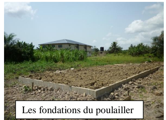
Les fondations du poulailler

Nous avons décidé de nous lancer dans ce projet à petite et moyenne échelle pour commencer, ayant à présent un terrain à disposition et deux personnes de confiance prêtes à s'investir.